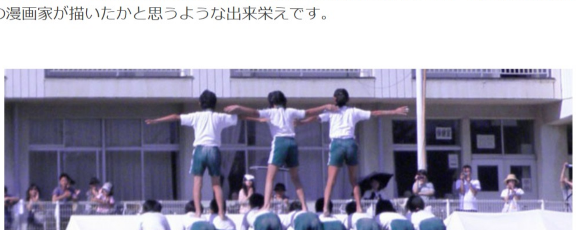
<組体操「君にエール」>

競技のものではないのですが、感動したことがもう一つありました。プログラムに載った挿絵です。競技をしている選手を描いたものですが、表情や雰囲気がよく出ていてプログラムに活気を吹き込んでくれるように思いました。各学年から選ばれたのですが、中でも表紙に使われた5年生の挿絵はプロの漫画家が描いたかと思うような出来栄です。