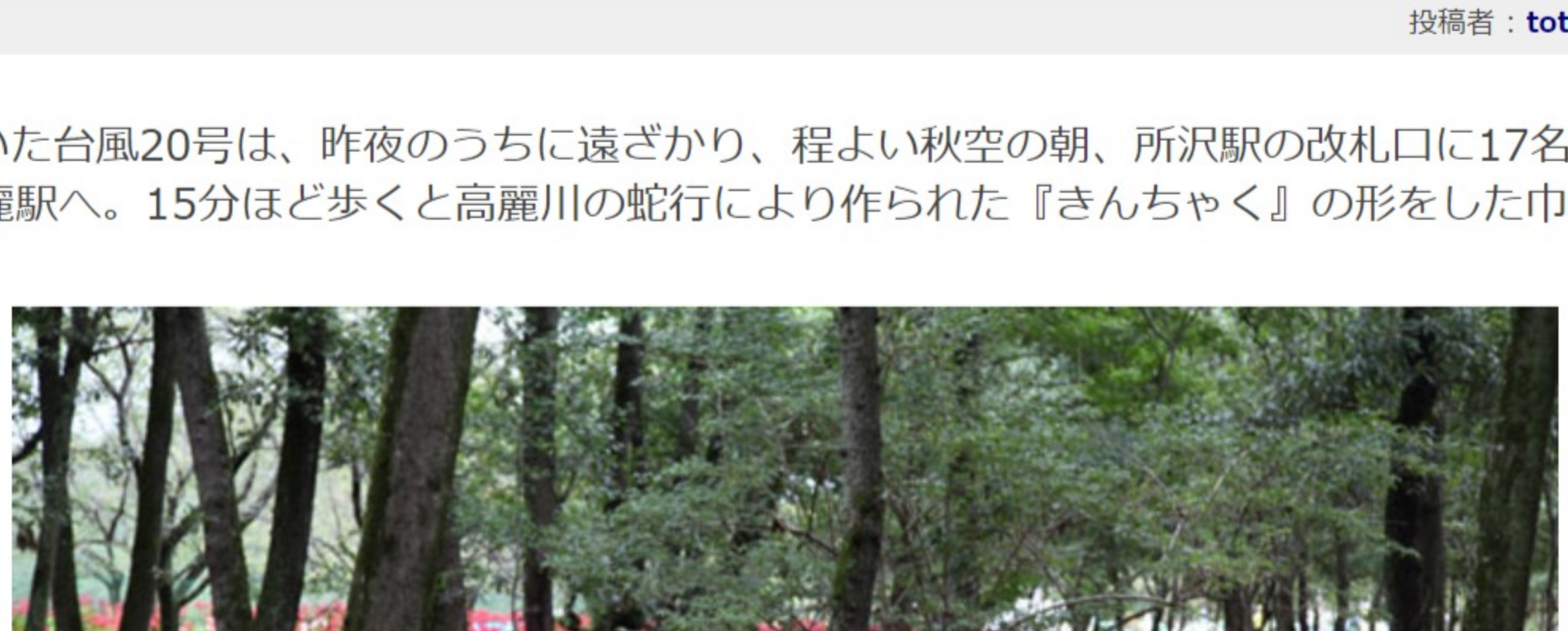
<赤い絨毯を敷き詰めたような曼珠沙華>

9月26日(木)、心配していた台風20号は、昨夜のうちに遠ざかり、程よい秋空の朝、所沢駅の改札口に17名の元氣一杯なハイカーが集まりました。西武電車で一路高麗駅へ。15分ほど歩くと高麗川の蛇行により作られた『さんちゃく』の形をした巾着田に到着しました。