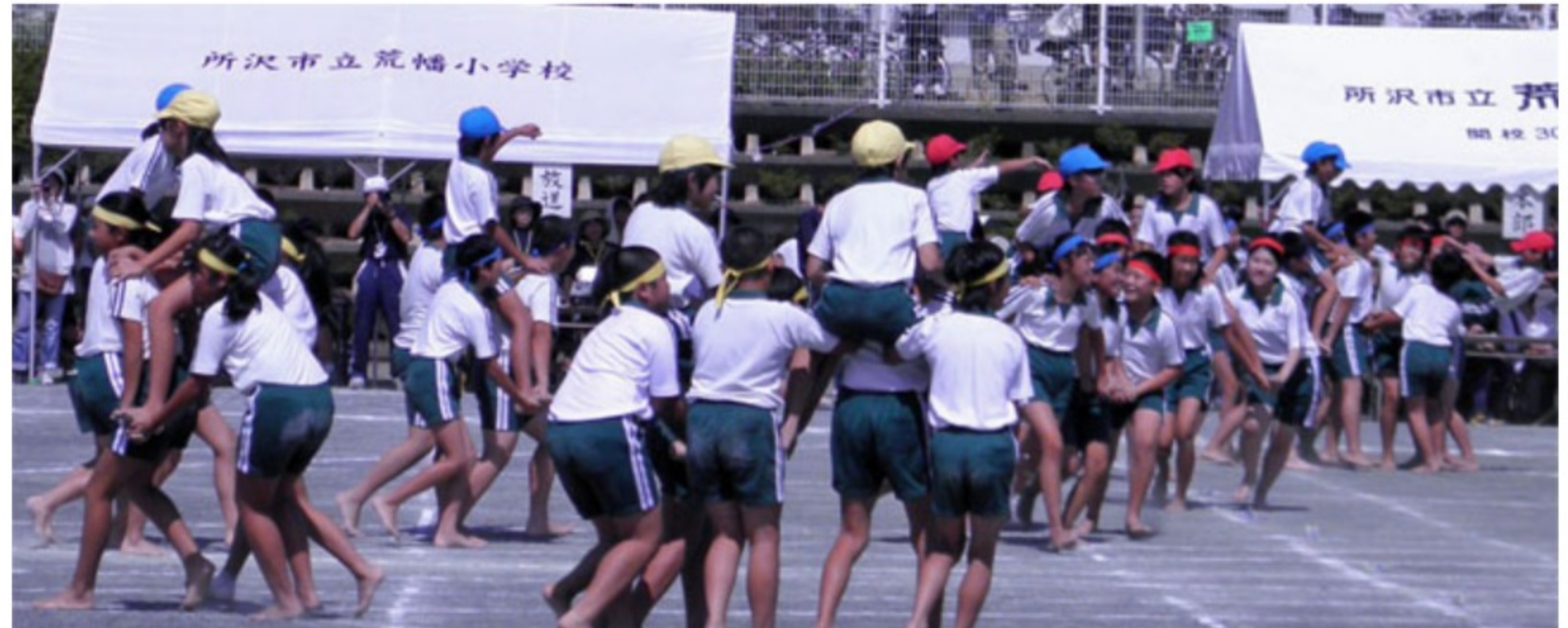
<騎馬戦「荒幡の合戦、秋の陣2013」>

校庭に入場し整列した児童を見ると、6年生はさすがに体格もよく堂々としている子が多かったのですが、1年生は本当に「かわいらしい」という言葉がぴったりで、中には幼稚園や保育園で見かけるような小柄な子もいて微笑ましい限りでした。8時40分から開会式などの一連の儀式が始まりました。この中に、各群の応援団長が競技をするにあたっての決意を述べる「誓いの言葉」、各群がお互いに励まし合う「エール交換」がありました。「敵」への対抗心を見せながらも相手への思いやりも伝えるところもあって、ピュアな世界を感じました。9時15分からのラジオ体操に引き続き競技が始まりました。