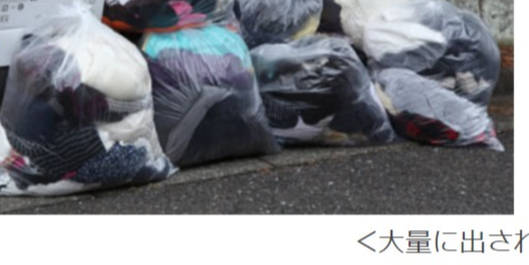
<大量に出された古着・古布>

10月4日(金)、7回目の集団資源回収終わりました。 毎回のみなさまのご協力に感謝いたします。 みなさまが資源物を出される時間は9時ちょっと前になり、心配された盗難は今月も報告がありませんでした。 古布・古着の量がだんだんと多くなってきています。燃えるごみとして出さずに資源回収の日にお出ください。