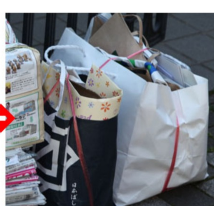
<雑がみは中身が出ないように口をしっかりしばる>

(3) 資源物を出す時刻 9時から回収が始まります。前日や、当日の早朝に出しますと盗難される恐れがありますので、8時から9時ちょっと前がベストです。