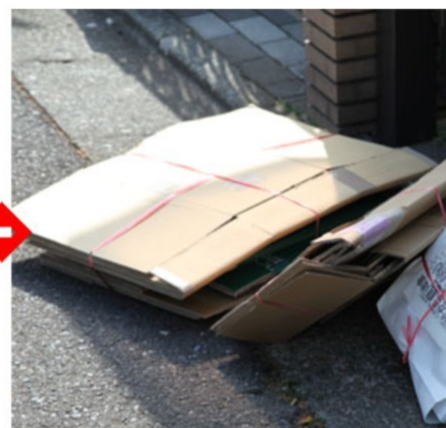
<ダンボールはビニールひもで十文字にしばる>

(2) 雑がみ 雑がみの中身が出てしまっている場合がありますので、雑がみは横に倒れても中身が出ないように口をしっかりしばるようお願いいたします。