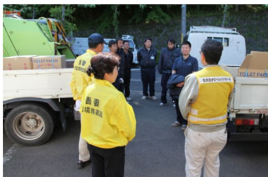
<作業開始前に会長のご挨拶>

第1回目は回収にだいぶ時間がかかり、ご迷惑をおかけしました。今回は、回収業者(エコ・クルー)の車の数と、職員の数も2倍になり、対応に全力をあげていただきました。