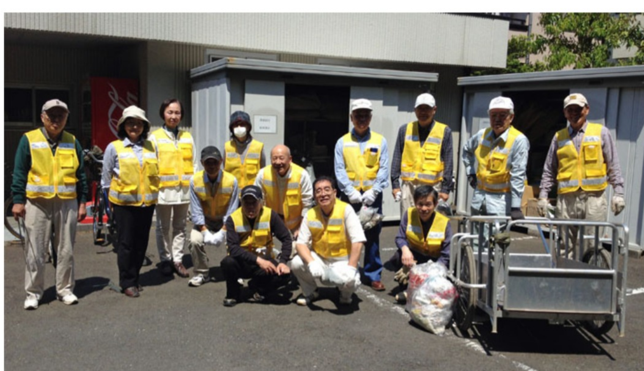
<清掃後の集合写真 ゴミを45リットルのゴミ袋2つ回収>

本日(4月27日)の定例環境クリーンパトロールの清掃では、参加者14名が松が丘の街、公園、八国山を清掃しました。