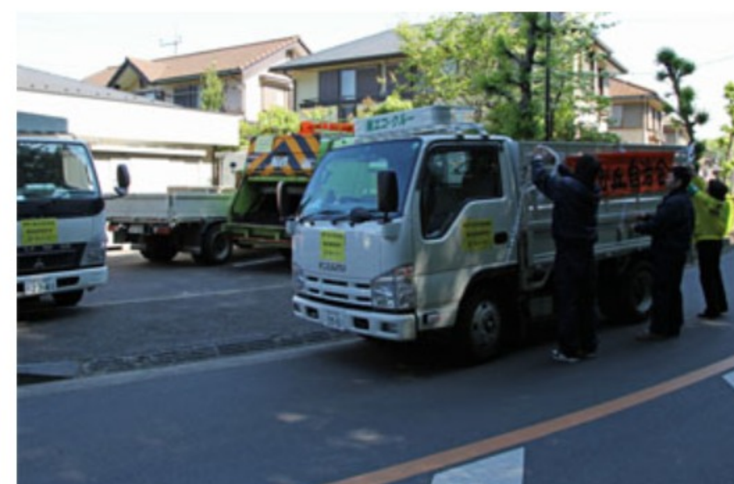
<回収車に「所沢松が丘自治会」の横断幕を取り付け>

朝の9時より回収がスタートし、大体の回収は昼の2時近くで終了しました。最後に回収漏れの確認をしてまわり、3時には業務を完了いたしました。