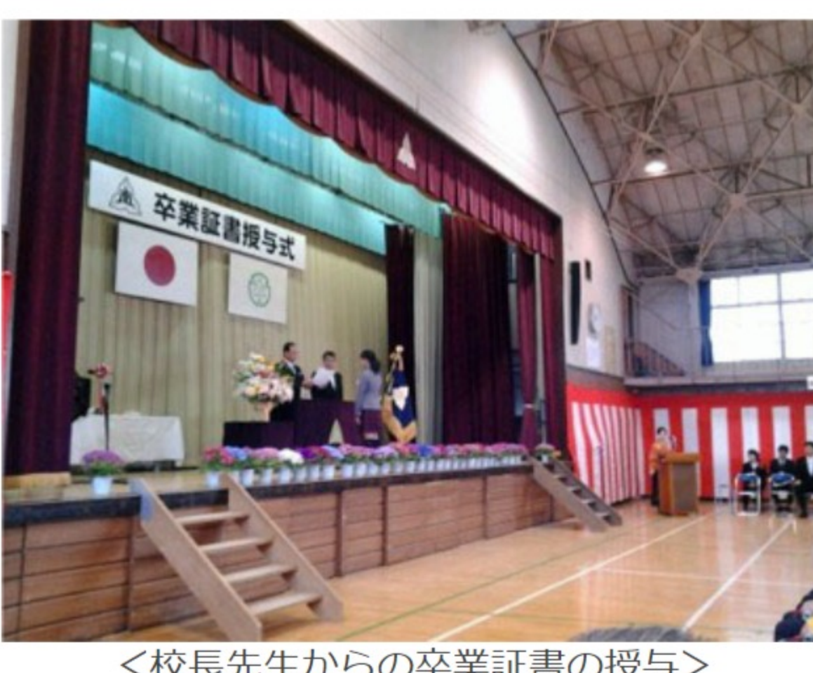
<校長先生からの卒業証書の授与>

恒例ではありますが、卒業証書を受ける前に、卒業生一人ひとりが壇上で「自分の夢と希望」を大きな声でみんなに伝えるという 大仕事 を見事にやっていたのは立派でした。