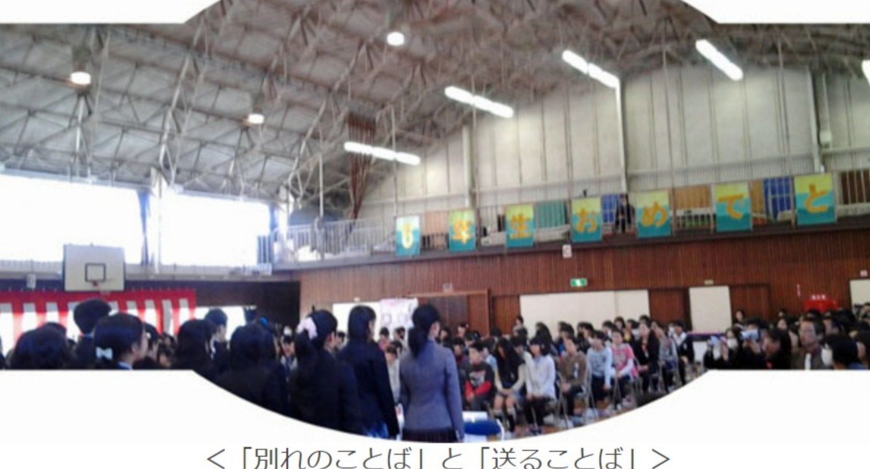
<「別れのことば」と「送ることば」>

最後に「別れのことば」「送ることば」では、卒業生から在校生にそして在校生から卒業生へと思いのことばが途切れることなくつづき、がんばったことや楽しかったことを思い出して涙ぐむ卒業生に先生も保護者も、もらい泣きでした。