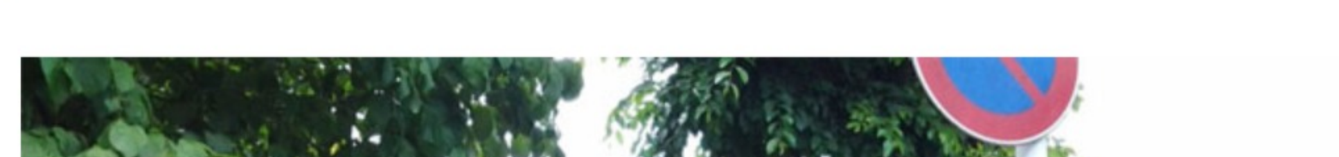
<「わんわんパトロール」決起集会>

6月15日(土)9時より中央公園にて、愛犬と一緒に参加した方をはじめ多くの方の参加で「わんわんパトロール」の決起集会が開催されました。昨夜までの梅雨の長雨が続いていましたので、当日は雨が心配でしたが、一転好天に恵まれました。