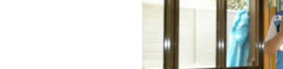
<古着・古布の回収>

25年度の4月から、毎月、自宅前で古着・古布の回収を集団資源回収でおこなっているので、わざわざ中央会館まで持ってくる6月9日の回収はほとんどないのではないかと思っていました。しかし、予想に反して古着・古布の資源として出されたものが、たくさんありました。また、「もったいない市」に出された服もたくさんありました。