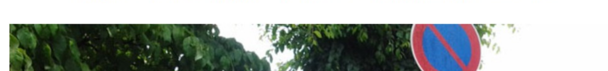
<パトロールのデモ>

引き続きパトロールのデモに移り、2社の新聞社の取材を受けながら、ワンちゃんと一緒に公園からスタートして、家への帰路を散歩しながらの流れ解散となりました。