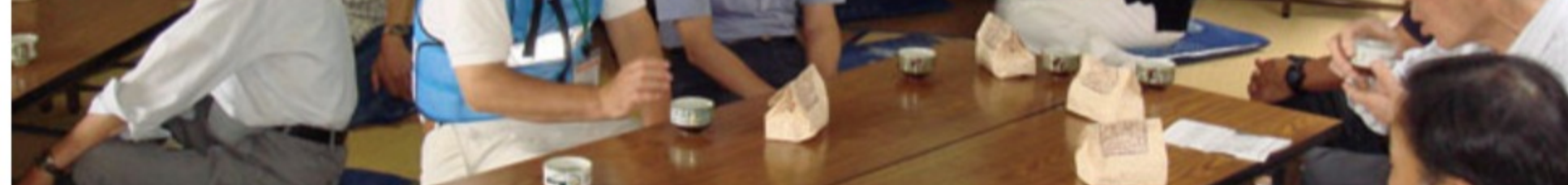
<久米中町茶のみ会>

6月9日(日)、近隣の町内会である久米中町町内会にて初めて開催された『久米中町茶のみ会』に2名で飛び入り参加しました。