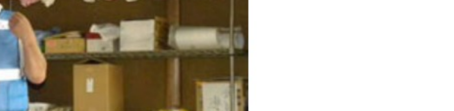
<「もったいない市」に出された服>

午前中にかけてこられた方的人数は134人、午後になってから持ってきた方的人数は39名でした。中央会館が会場になっていましたが、午前中はだいぶにぎわっていました。