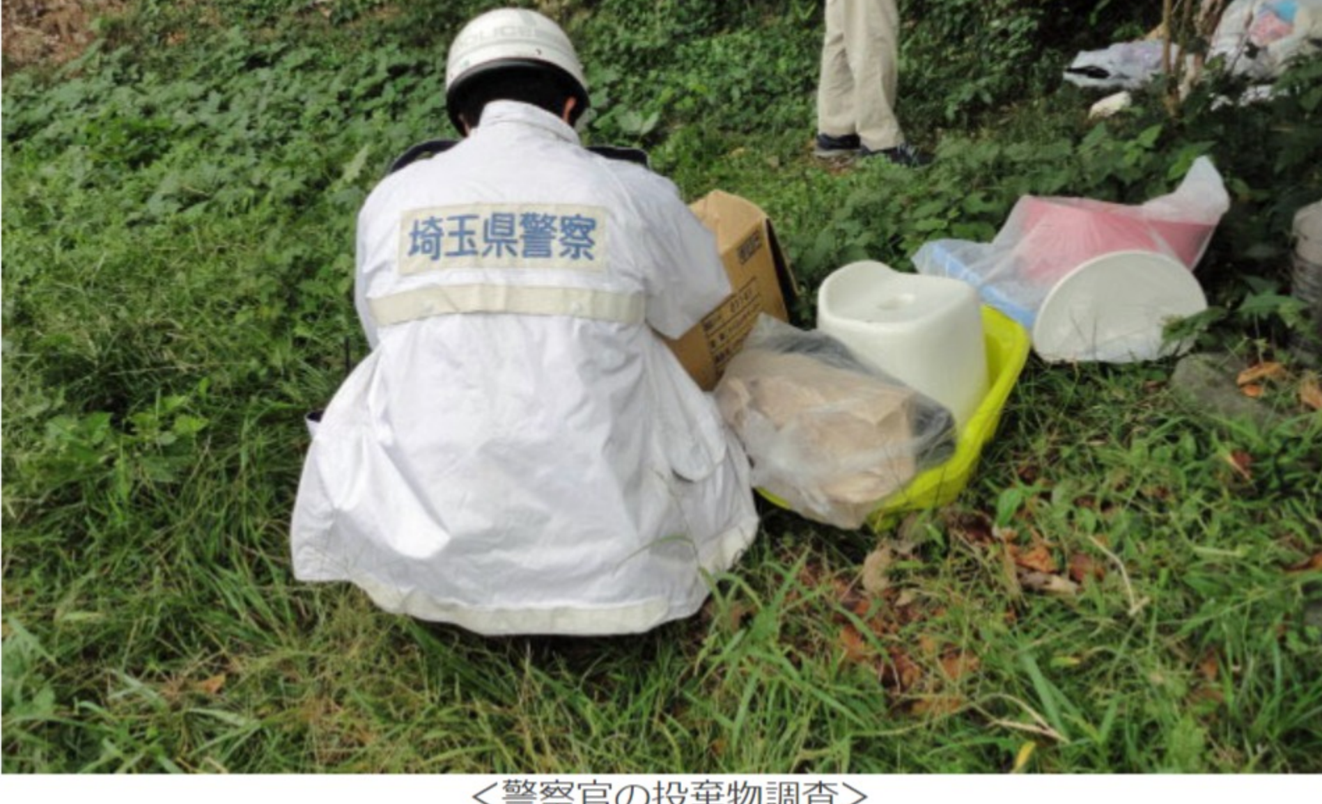
<警察官の投棄物調査>

警察官の投棄物の調査では、すでに営業していないお店の領収書などから何年も前の不要物らしいとのことでした。