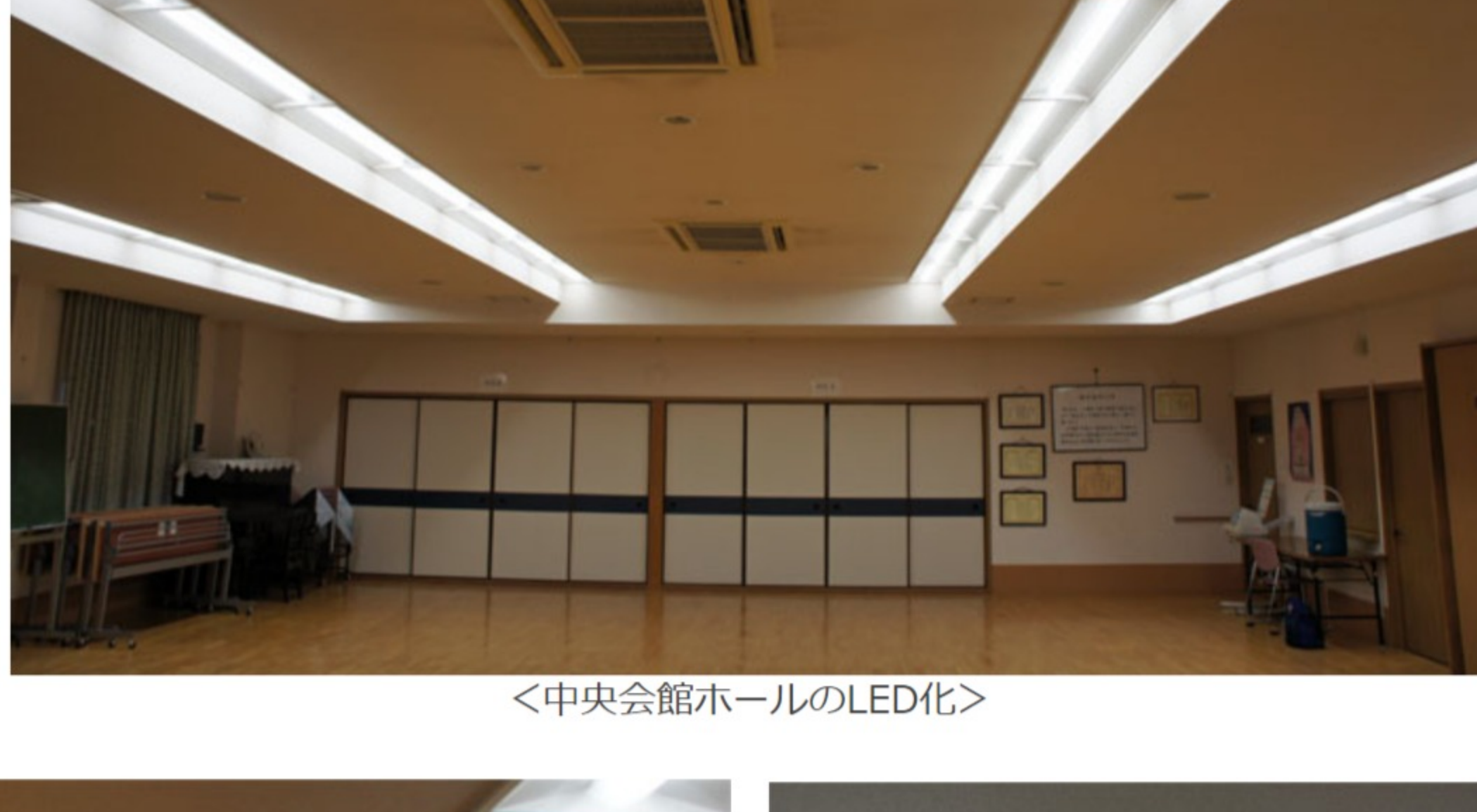
<中央会館ホールのLED化>

電気代も軽減されることとなります。また、冬場、蛍光灯の場合には、暫くの間チカチカしていたことも解消されます。スイッチを入れると瞬時に点灯します。