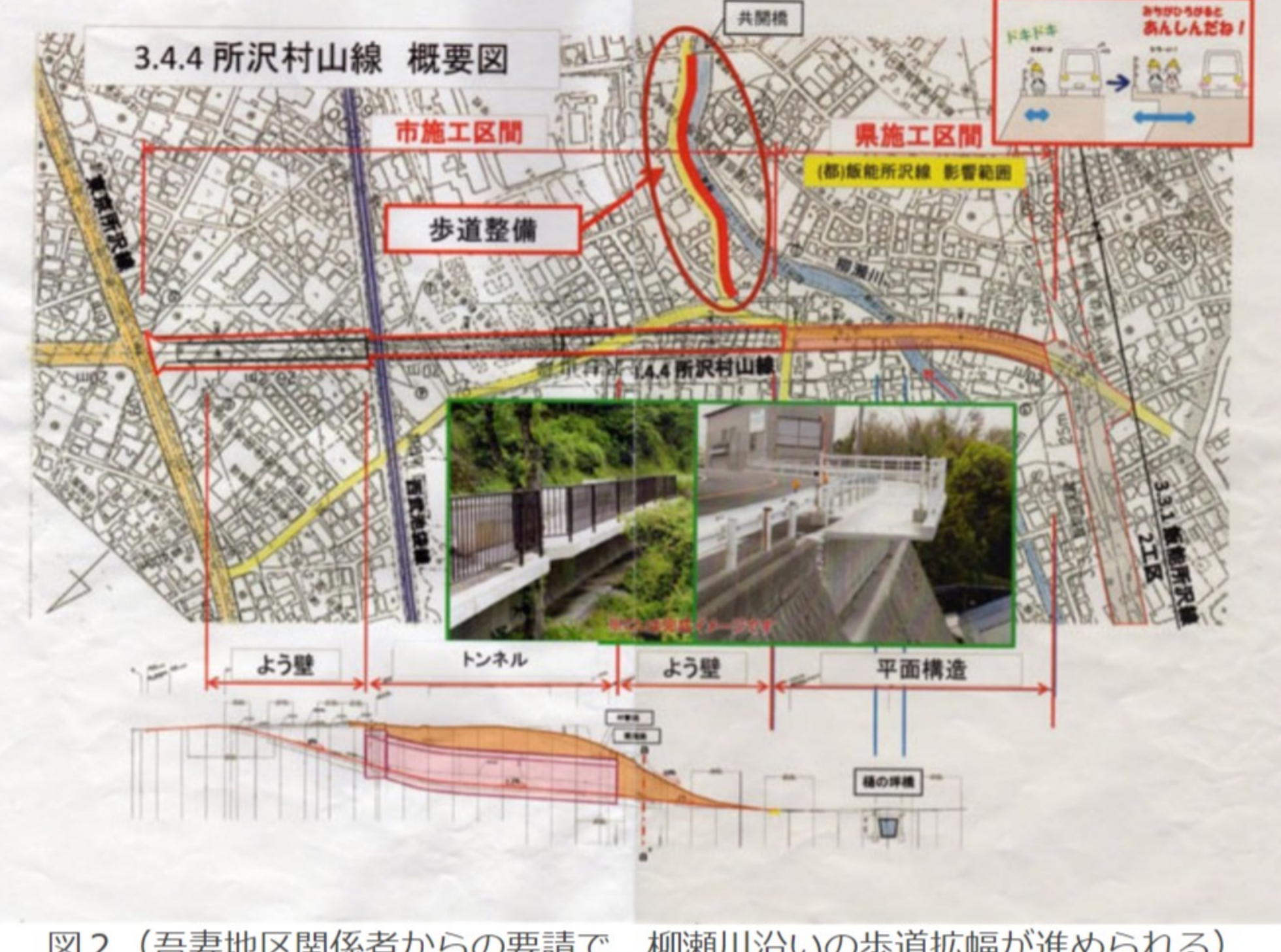
図2 (吾妻地区関係者からの要請で、柳瀬川沿いの歩道拡幅が進められる)