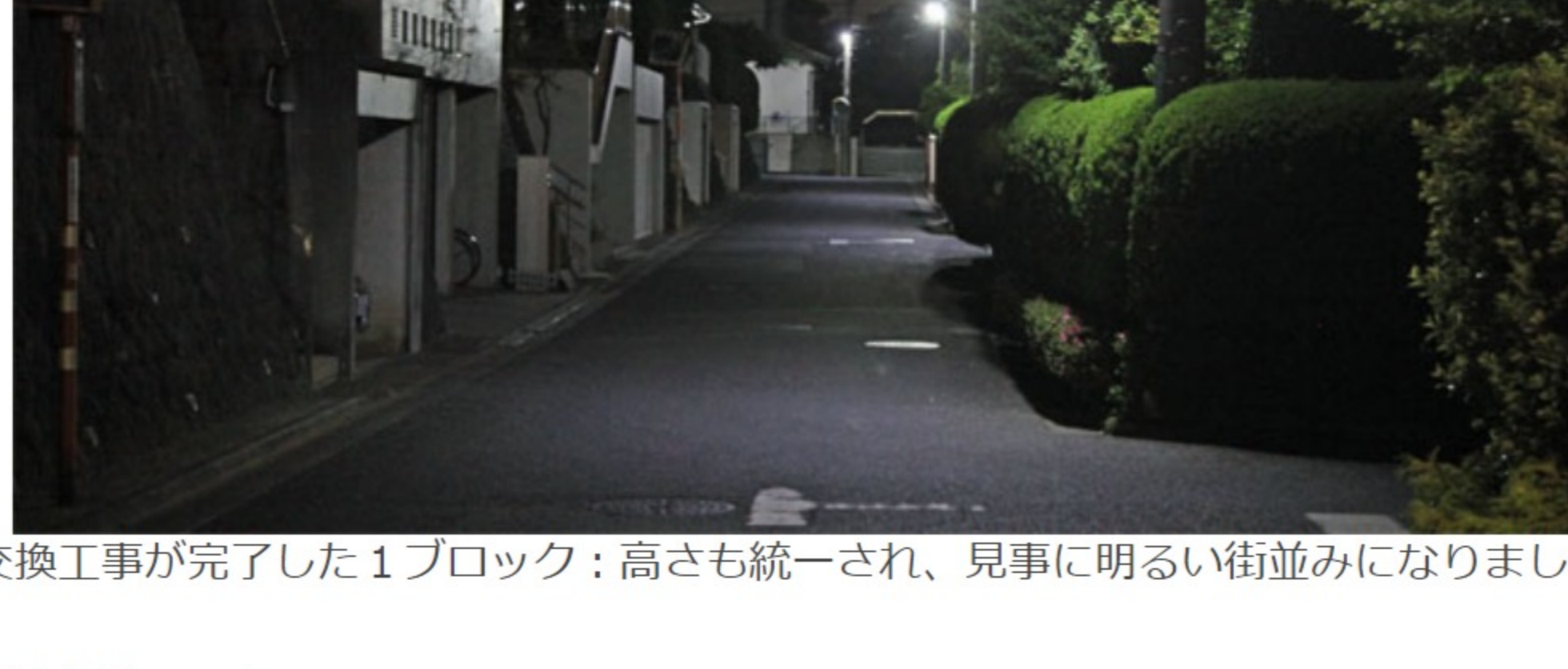
<交換工事が完了した1ブロック；高さも統一され、見事に明るい街並みになりました>

5月の第31回定期総会において、30周年記念事業として防犯灯のLED化が承認されました。その後この事業を推進するプロジェクトチームが結成され、全地域の防犯灯の現状を確認のうえ、交換個所の決定などの工事の準備を進めてきました。その結果、6月初旬より順次交換工事が開始されることとなりました。会員みなさんのご理解とご協力をお願いいたします。