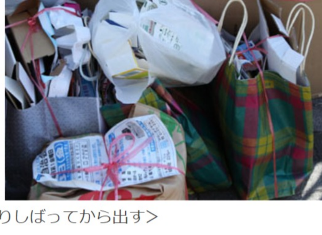
＜雑がみは口をしっかりとしばってから出す＞