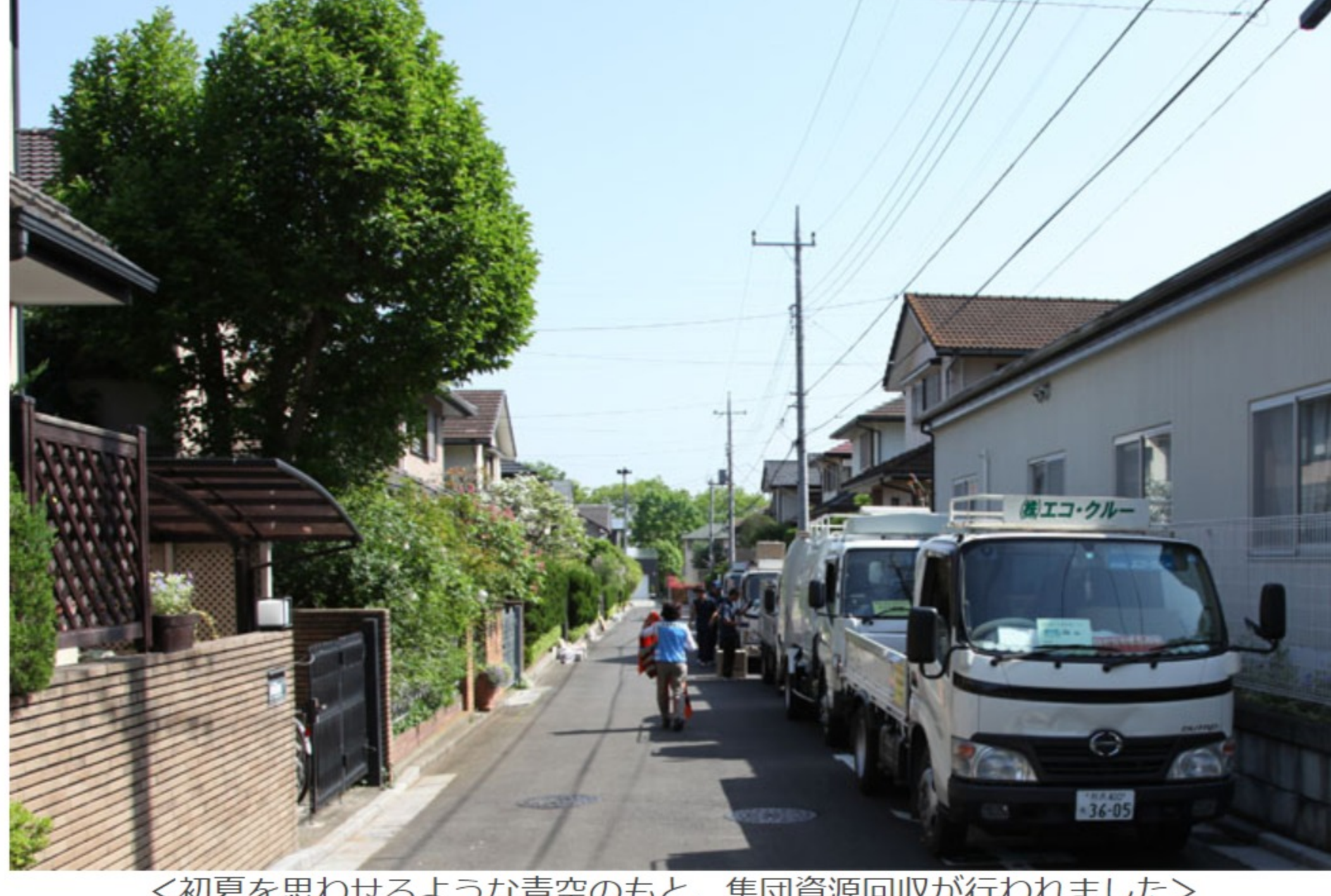
＜初夏を思わせるような青空のもと、集団資源回収が行われました＞

5月1日（金）、27年度2回目の集団資源回収がおこなわれました。初夏を思わせるような青空のもと、集団資源回収は気持ちのいい1日でした。