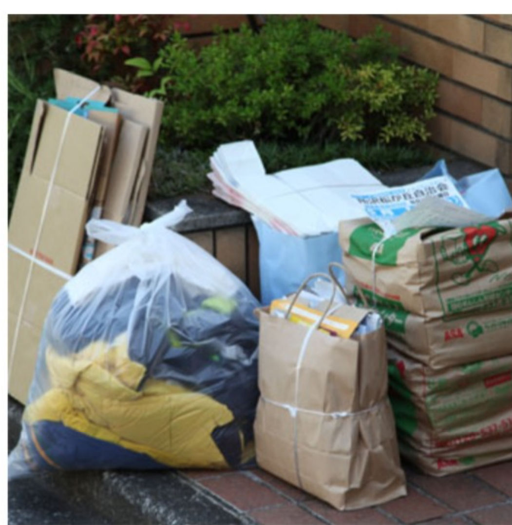
＜雑がみを含めた大量の資源物＞